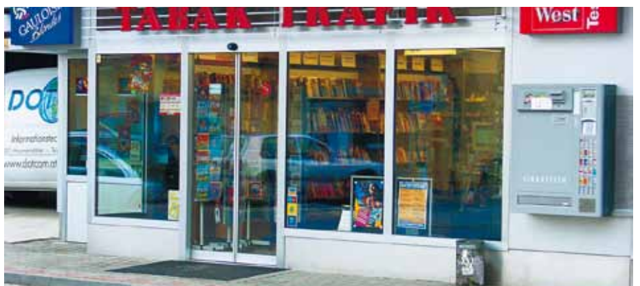
Porte retardatrice d'effraction – Tabac, Autriche