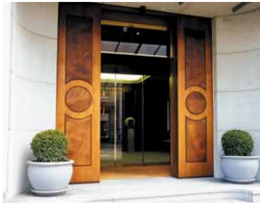
Porte coulissante retardatrice d'effraction – Banque, Suisse