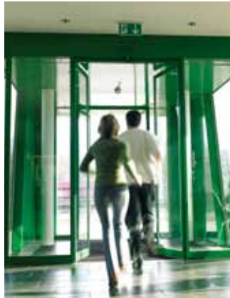
Porte coulissante avec système „break out” pour les cas d'urgence

Le système RED a été conçu spécialement pour les chemins de fuite. Le modèle redondant garantit un fonctionnement de la porte automatique même en cas de rupture d'alimentation ou d'un défaut du système. Le système RED est équipé d'une unité intelligente de commande assurant périodiquement un autocontrôle des fonctions principales de la porte. Le système de sécurité répondant aux obligations de la norme CO48 est un système mécanique intégré dans le mécanisme de la porte, permettant l'ouverture automatique de cette dernière en cas de coupure d'électricité.