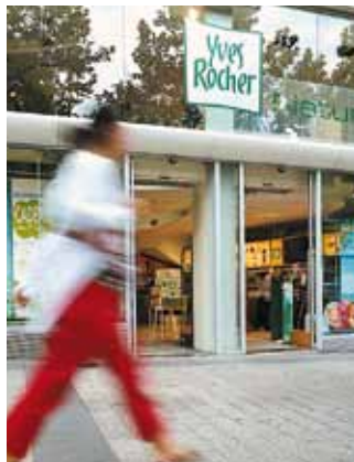
Porte coulissante – Centre de beauté, France

La porte à enroulement rapide record SPEEDCORD avec protection contre les impacts est utilisée à l'intérieur des centres de distribution ou dans les entreprises de logistique.