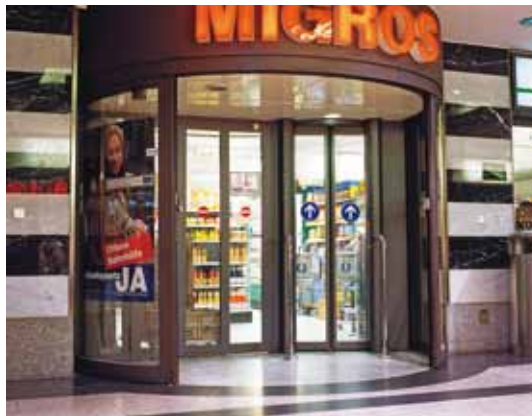
Porte tambour – grande surface alimentaire, Suisse