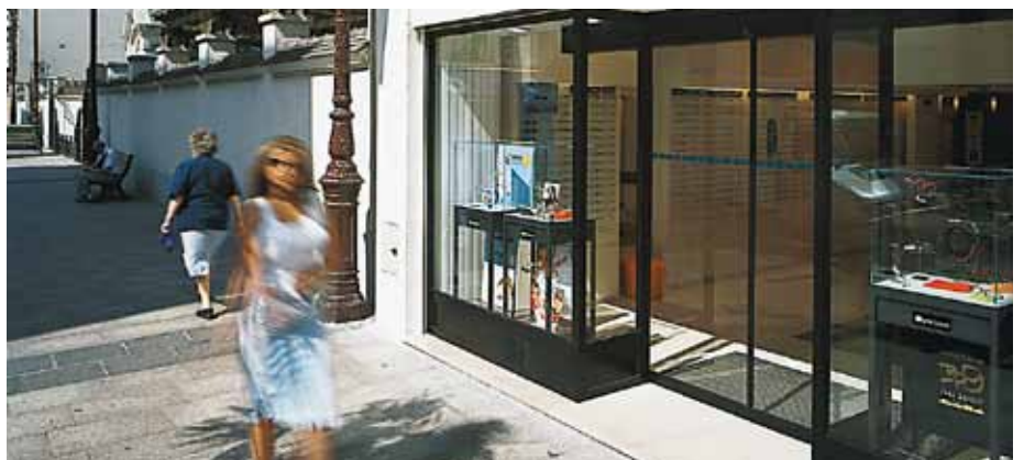
Porte coulissante – Opticien, France