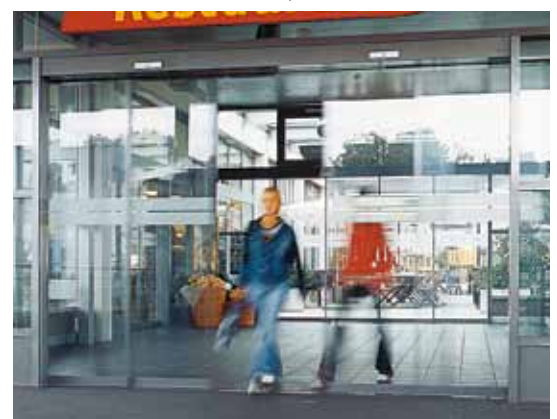
Porte coulissante télescopique – Restaurant, Suisse