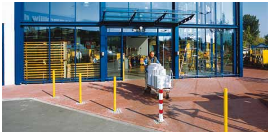
Porte coulissante renforcée 065 RTA – Magasin de bricolage, Allemagne