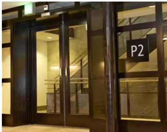
Porte coupe-feu EI30, Zurich, Suisse

Le FlipFlow est un système automatique pour l'accès en sens unique. Il comprend une porte battante à deux vantaux et un portillon automatique empêchant tout retour en arrière, grâce à la fermeture automatique des barrières. Les vantaux de la porte battante se fermeront et se verrouilleront immédiatement, et l'incident sera transmis au système de contrôle du bâtiment. Facilement intégrable dans des systèmes de sécurité existants, le FlipFlow a été installé en Europe dans de nombreux lieux publics où la sécurité s'impose. Il peut être utilisé en tant que deuxième entrée dans des supermarchés et des centres commerciaux.