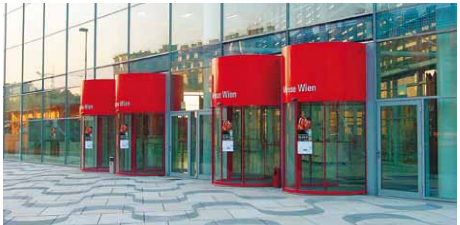
Porte ronde – Parc d'expositions, Autriche