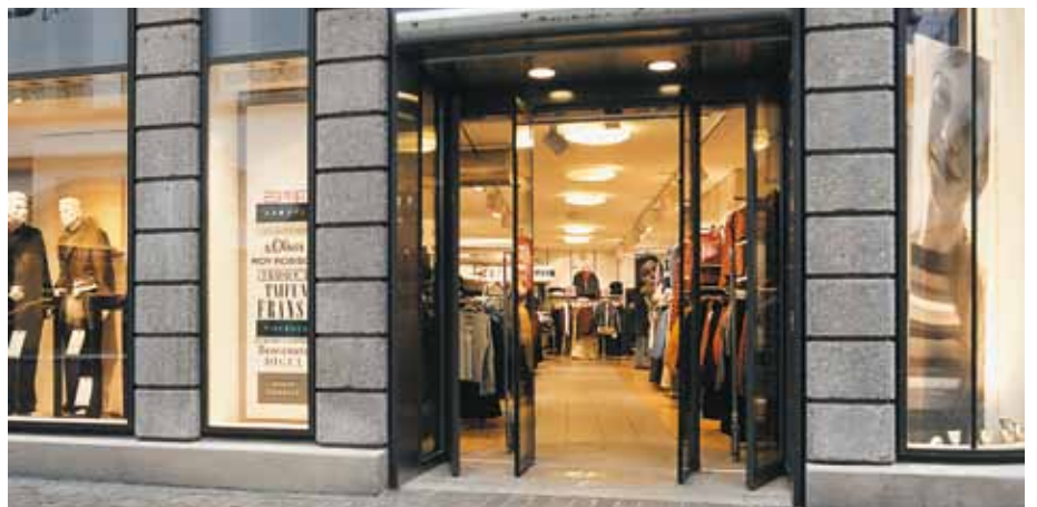
Système à ouverture intégrale, St-Gall, Suisse