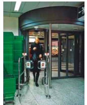
record FlipFlow – Supermarché, Suisse