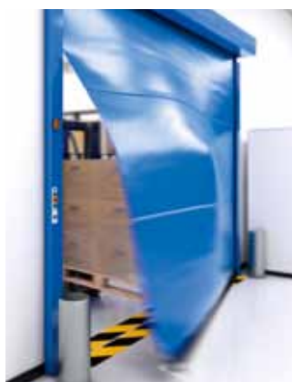
record SPEEDCORD avec protection contre les impacts