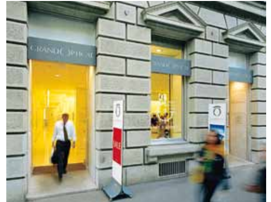
Porte coulissante – Magasin, Suisse