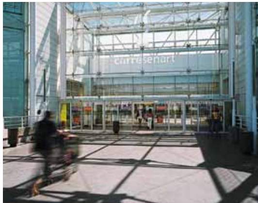
Porte ouverture intégrale – Centre commercial, France