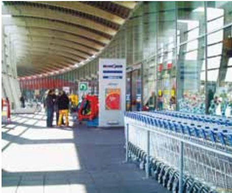
Centre commercial – Fulda, Allemagne

Aujourd'hui, record fabrique et installe une vaste gamme de portes automatiques et de périphériques afin de répondre à tous les besoins et de s'adapter à tous les usages.