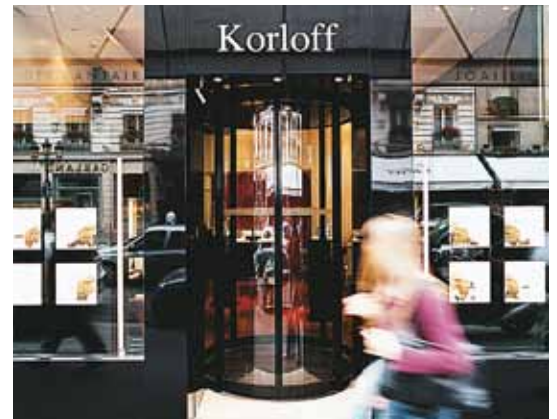
Porte ronde – Bijouterie, France