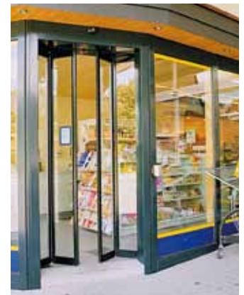
Porte pliante (avec système de secours) - Librairie, Suisse