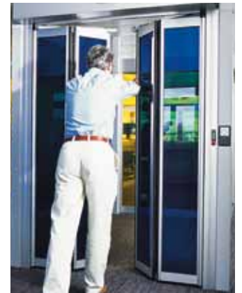
Porte pliante avec système de sécurité „break out” FBO